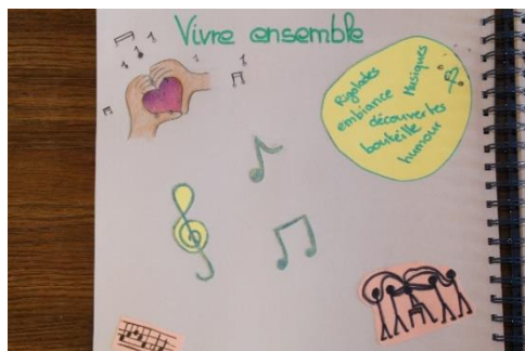
Vivre ensemble selon des adolescents